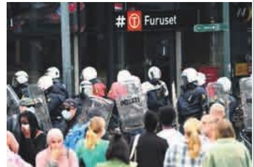
BRUSHODER PÅ FERDE: Unge demonstranter som bruker vold mot Sian-aktivister kan ikke forsvares, skriver forfatteren. Her fra Furuset i Oslo 15. august.